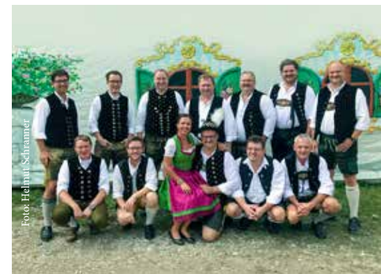
Hollédauer Musikanten www.hollédauer-musikanten.de

Die Holledauer Musikanten sind eine Blaskapelle aus dem Herzen der Hallertau, dem ältesten Hopfenanbaugebiet der Welt. Unser Name steht für traditionelle und bodenständige Blasmusik, die sich im Wandel der Zeit auch konzertant und modern darstellt. Mit einem reichhaltigen Repertoire spielen wir neben bayerisch-böhmischen Polkas, Märschen und Walzern auch unsere Hallertauer Besonderheit – den Zwiefachen. Zudem bringen wir Big-Band-Musik und die Klassiker von Glenn Miller auf die Bühne. Erleben Sie mit uns die echte bayerische Lebensart und musikalische Vielfalt.