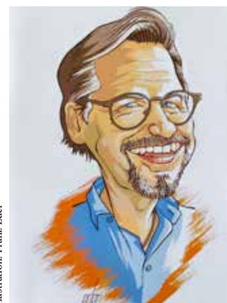
Illustration: Franz Eder